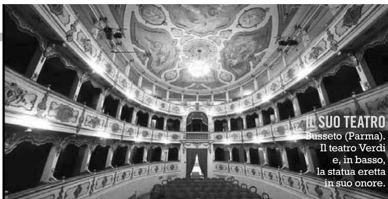
IL SUO TEATRO Busseto (Parma). Il teatro Verdi e, in basso, la statua eretta in suo onore.